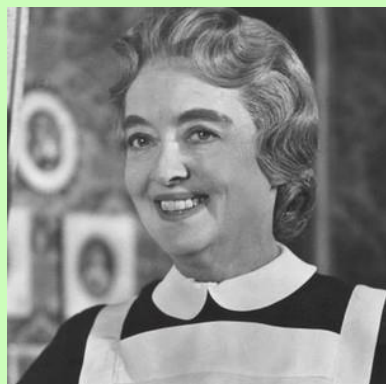
良家に仕える模範的乳母

日本発売 DVD 表紙: 20 世紀フォックス・ホーム・エンターテインメント・ジャパン