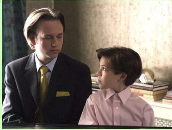
大好きな叔父さんと一緒にのジョシュア

『ジョシュア 悪を呼ぶ少年』<未>(2007)/原題 JOSHUA/ 上映時間 106 分/ 製作国 アメリカ/ 劇場未公開/ ジャンル: ホラー、サスペンス/ DVD 販売元: 20 世紀フォックス・ホーム・エンターテイメント/ ジャパン/