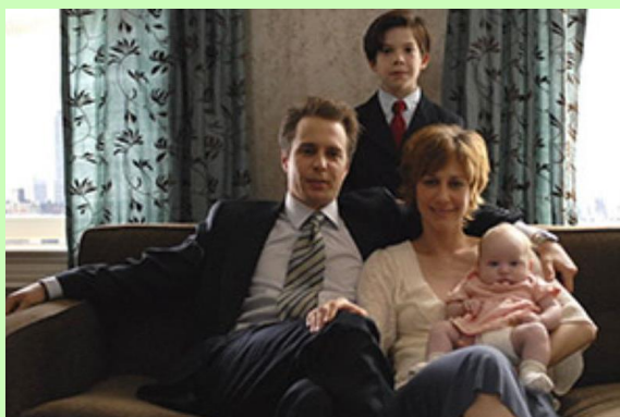
NY エリートの家族写真