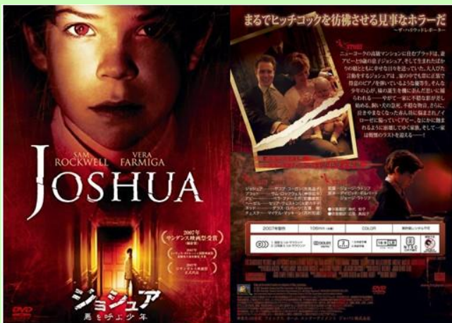
『ジョシュア』 DVD 表紙

しかし、それは犯罪にならない範囲において許される。人の命を奪ったり、社会に重大な被害を与えない場合においてのみ目をつぶれる。いたずらと犯罪には明確な境界線が存在する。「凶悪犯罪」とされる殺人、強盗、放火、強姦などの領域に踏み入ってしまった男児は、未成年であれば少年院送りになり、罰を受ける。残念なことに少年による凶悪犯罪も現実には存在する。特に 10 歳以下の知能犯、それもサイコパス(良心や罪の意識が欠落した精神病質者、あるいは反社会性人格障害者)によるものは本当に恐ろしい。私は最近その手の怖い映画を偶然見ってしまった——『ジョシュア——悪を呼ぶ少年』( Joshua , 2007 年)と『妖婆の家』( The Nanny , 1965 年)の二作品である。