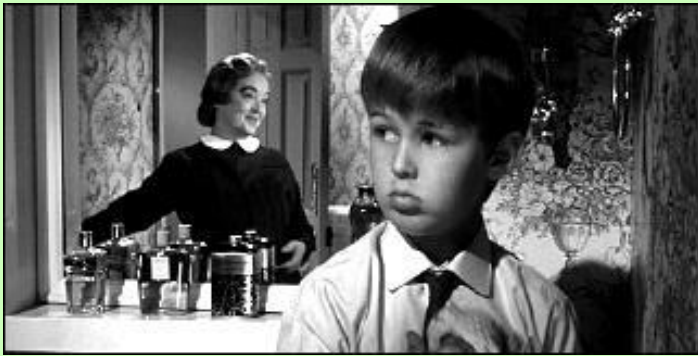
年老いたナニーを毛嫌いするジョシュア