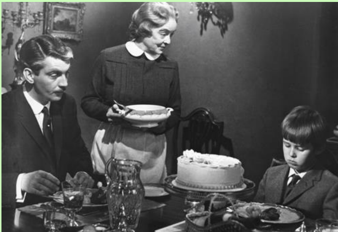
ジョシュア帰宅を歓迎するナニーの手料理：浮かない顔のジョシュア

『ジョシュア』は、ベティ・デビス主演の『妖婆の家』（ The Nanny , 1965）の本歌取りだと思われる。本歌取りとは、歌学用語で「典拠のしっかりした古歌（本歌）の一部を取って新たな歌を詠み、本歌を連想させて歌にふくらみをもたせる技法」（『ブリタニカ国際大百科事典 小項目事典』）である。本歌にあたる『妖婆の家』でも 10 歳になる良家の少年ジョーイは、悪童を超えた問題児である。幼い妹の死に手を下したとされて、施設に 2 年間収容された後、帰宅